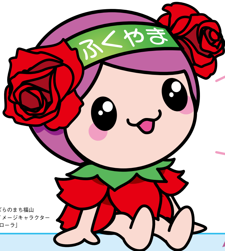
ばらのまち福山 イメージキャラクター 「ローラ」