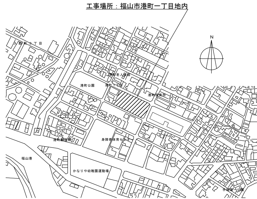
港町市営住宅 附近見取図 Non Scale