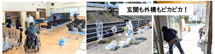
玄関も外構もピカピカ!