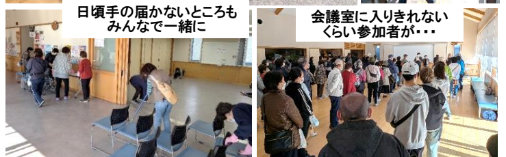
会議室に入りきれないくらい参加者が...