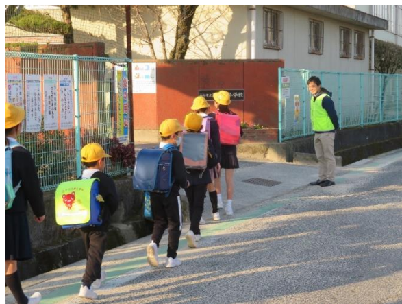
「おはよう」の元気な声が響いていました

『人と人が出会い、つながり、安心して暮らせるまちづくりをめざして』を目標に、引き続き、あいさつ運動へのご協力をよろしくお願いいたします。