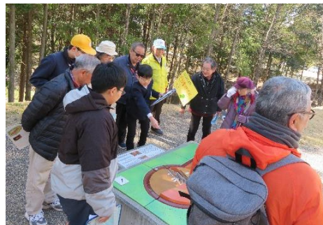
模型や、実際に石室の中へ入り説明をする駅西小6年生