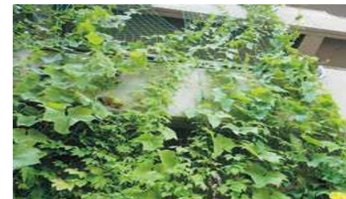
あどり 緑のカーテンの設置