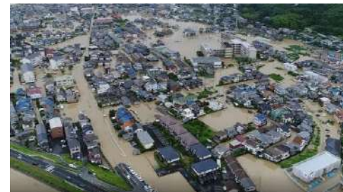
ねん へいせい ねん がつ 2018年（平成30年）7月 にしにほんごう 西日本ごう雨