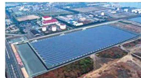
たいようこうほつでん 太陽光発電システムの設置 福山太陽光発電所【メガソーラー】