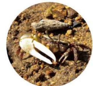
ハクセンシオマネキ