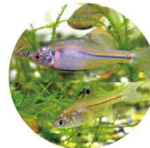
スイゲンゼリタナゴ

広島県では、1994年（平成6年）に野生動植物を守るための「広島県野生生物の種の保護に関する条例」が制定されました。これは、県内にすむ貴重な野生動植物を共に生きる仲間として守っていかうとするものです。この条例により、スイゲンゼリタナゴをはじめ11種の野生動植物が指定されており、これらをとることは禁止されています。