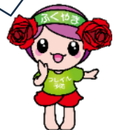
「フレイル予防ローラ」