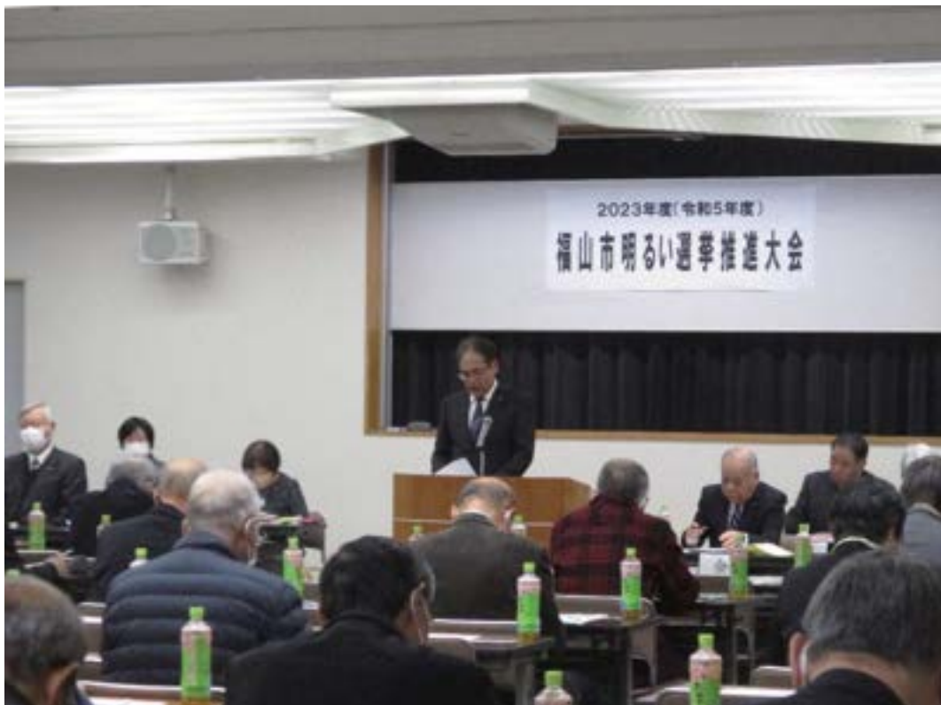
福山市明るい選挙推進大会