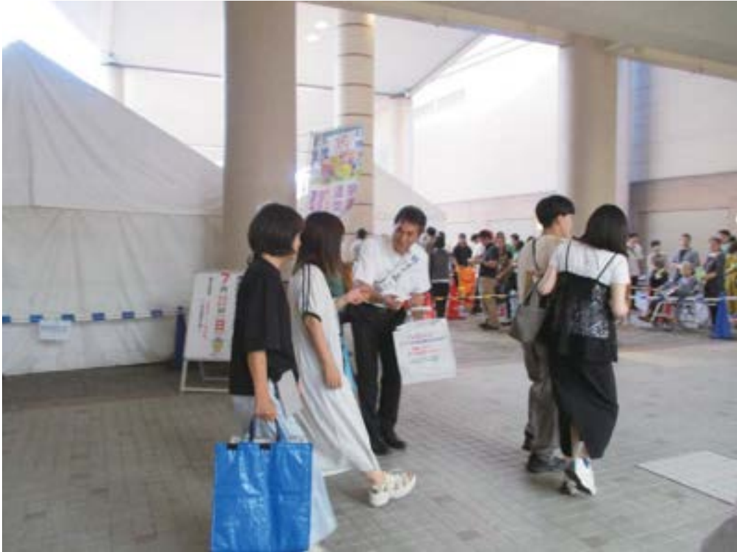
参議院議員通常選挙街頭啓発