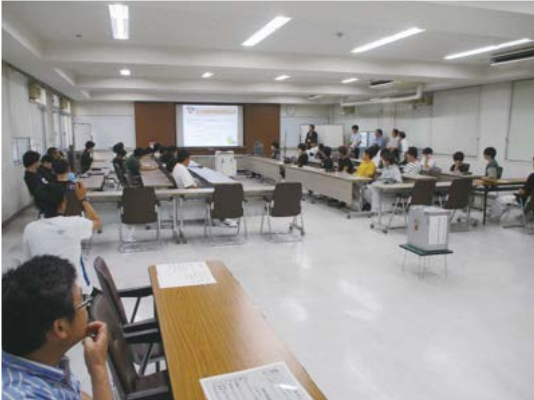
定時制高校での選挙出前講座