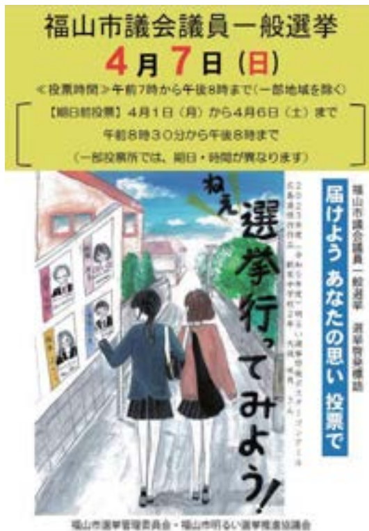
選挙啓発用ポスター