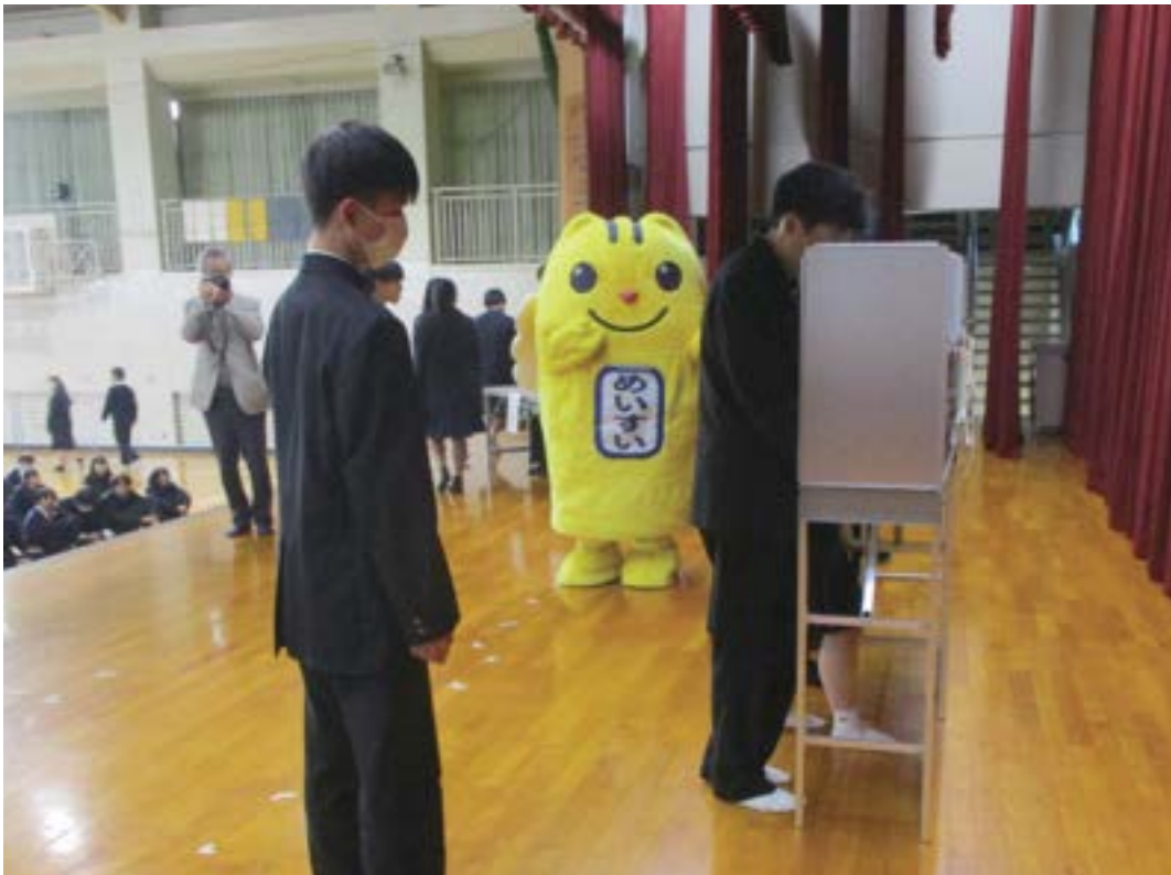
高校での選挙出前講座（模擬投票）