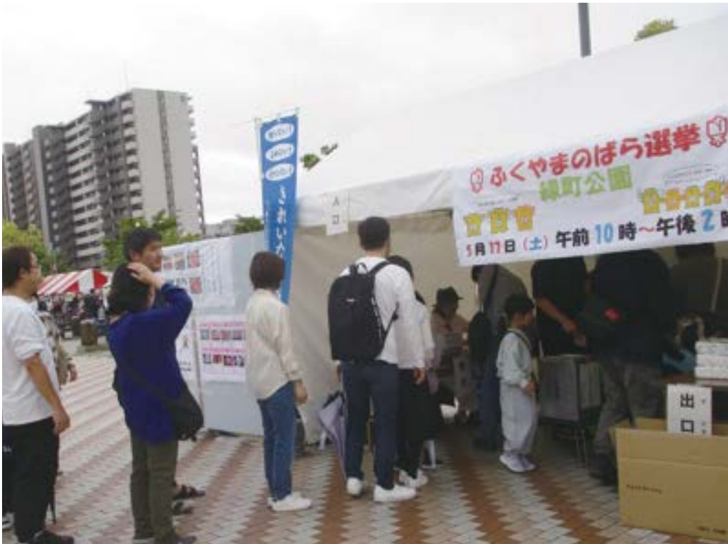
ばら祭りにおける啓発