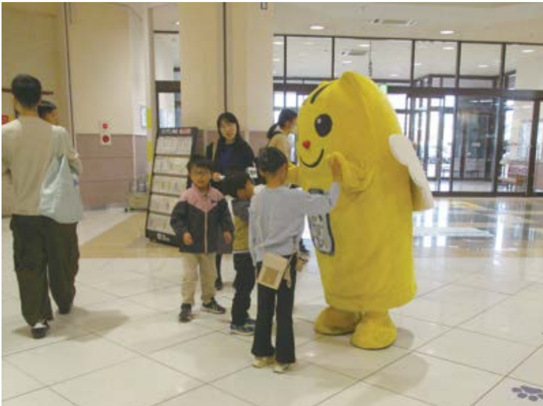
広島県知事選挙街頭啓発