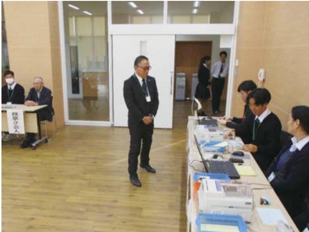
高校での期日前投票（広島県知事選挙）