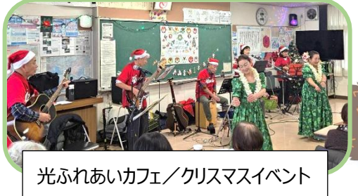
光ふれあいカフェ/クリスマスイベント