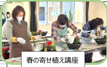
春の寄せ植え講座