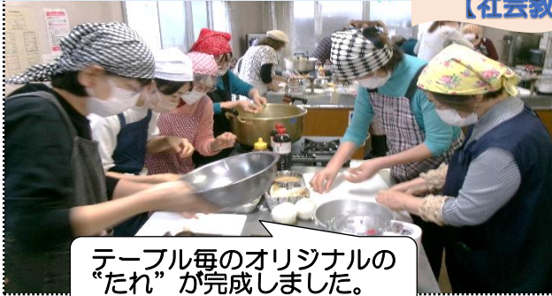
テーブル毎のオリジナルの“たれ”が完成しました。