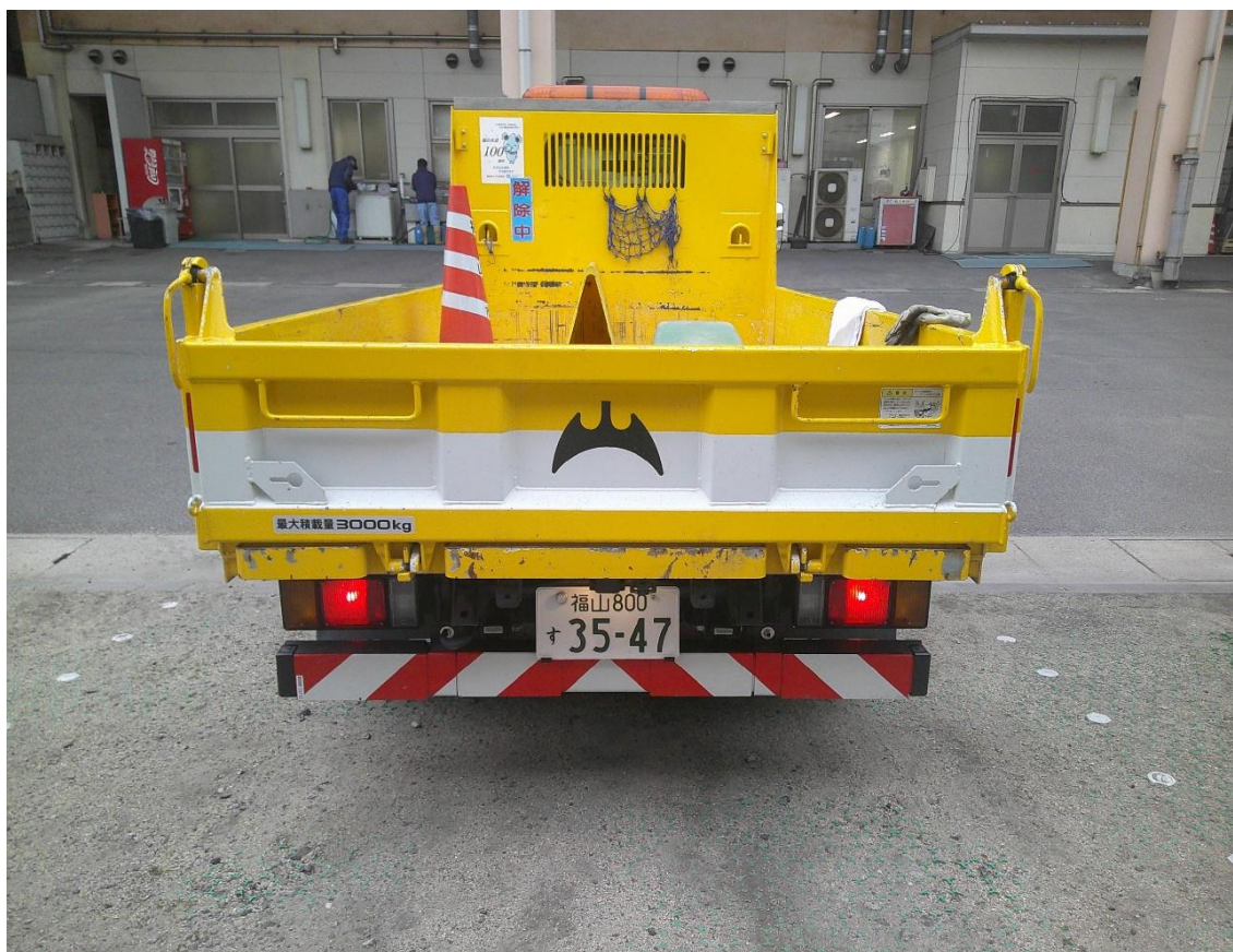
※画像は2 t ダンプの背面画像