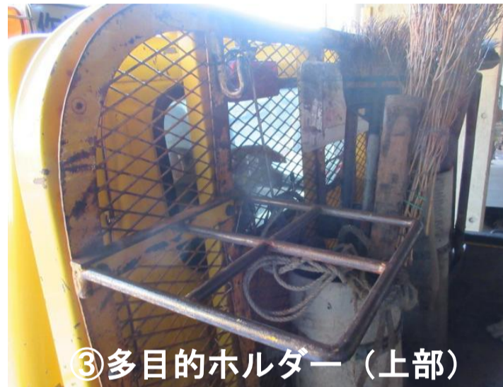
③多目的ホルダー（上部）