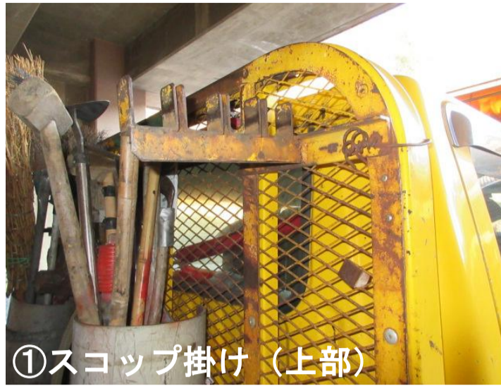
①スコップ掛け（上部）