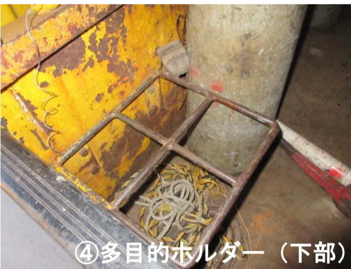
④多目的ホルダー（下部）