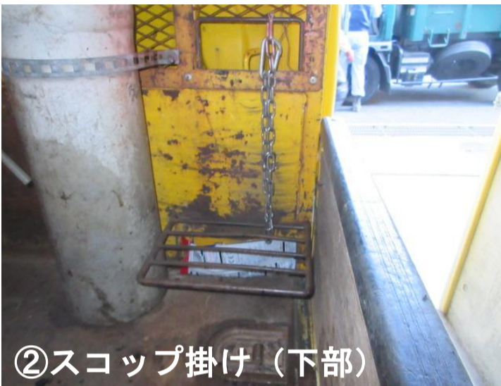
②スコップ掛け（下部）