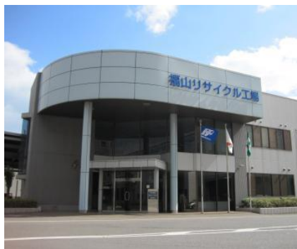
《福山ローズ エネルギーセンター》