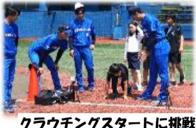
クラウチングスタートに挑戦