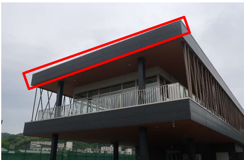
②管理棟 2階壁面（芦田川側）