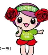
「フレイル予防ローラ」