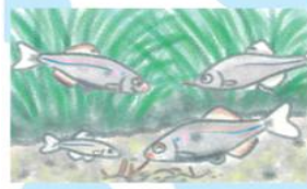
スイゲンゼニタナゴの おはなし