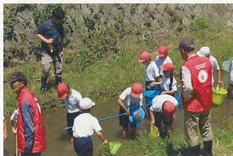
服部の自然を守る会より

約60人あまりが一斉に川探検をしますので、地域の多くの皆さんで見守り活動をお願いしたいと思います。