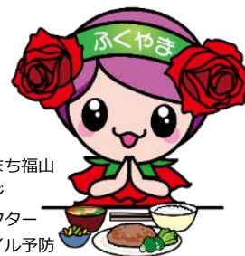
ばらのまち福山 イメージ キャラクター 「フレイル予防 ローラ」

食生活改善推進員による講義と、参加者の皆さんで調理実習を行い、試食（1/2食量程度）をします。楽しく食生活のポイントについて、学びましょう！