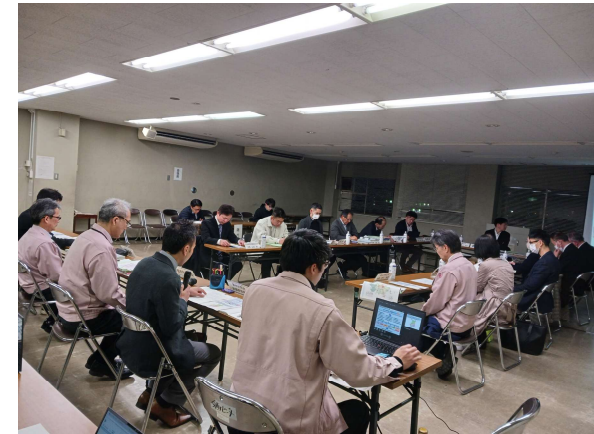
第6回検討委員会の様子