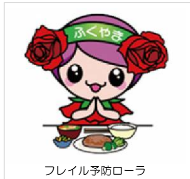
フレイル予防ローラ