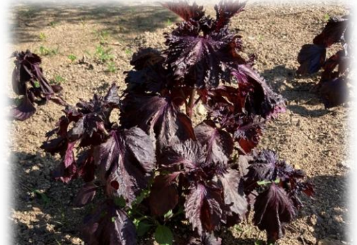
旭南公園で育てている赤紫蘇を使って作ります！