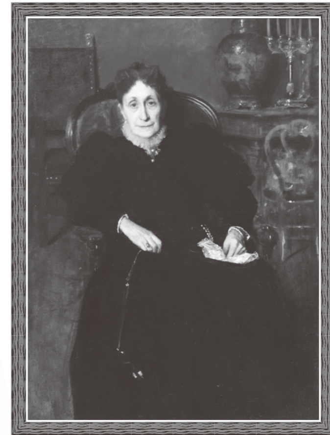
ジョヴァンニ・セガンティーニ《婦人像》1883～84年 ふくやま