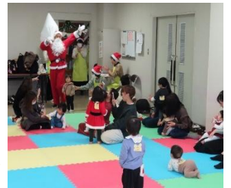
スマイルキッズ （12月9日）