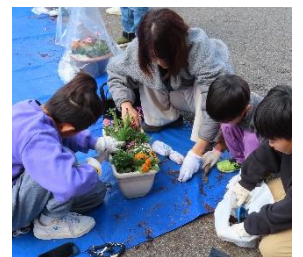
花いっぱい松永（2月28日）