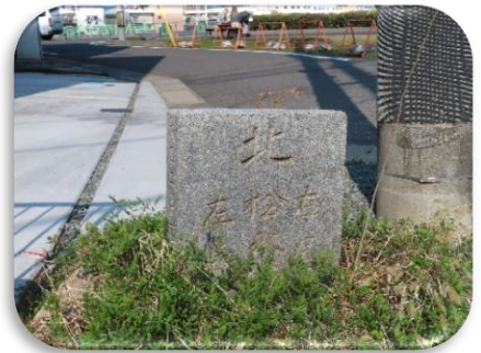
道 標：中央に「北 松永停車場」右に「尾道」 左に「鞆街道」

西部市民センター⇒湯屋ヶ橋周辺⇒胡神社⇒ 潮崎神社境内・加藤助二郎顕徳碑⇒ 明神橋⇒神島沖横入川⇒天宝橋・天保山⇒金毘 羅常夜燈⇒ 稲荷神社・小四郎神社・潮留樋門跡⇒小代島豎 入川⇒ 徳島横入川・大木屋橋(とくら橋)⇒今津島豎入 川⇒西部市民センター