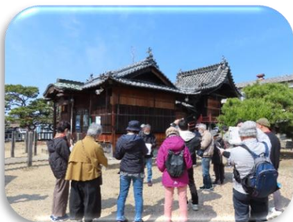
稲荷神社：右に「小四郎神社」がある