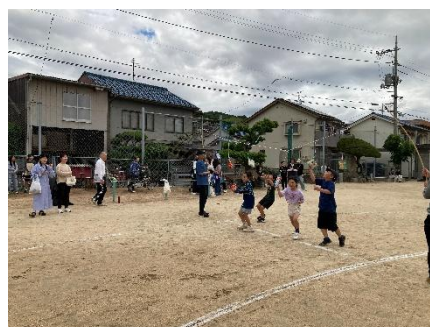
がぶりといこうぜ