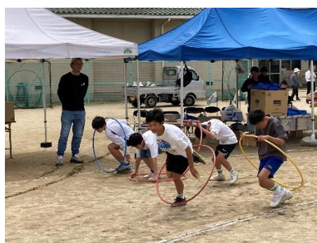
くぐって、とんで、おちないで