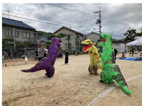
恐竜コスプレで競技も

恐竜コスプレやキッチンカーを活用するなど、子どもが参加しやすい競技を増やす工夫をすることで子どもやその家族も参加することになり、全体の参加者が増えた。