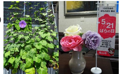
〔グリーンカーテン・ばら育成〕