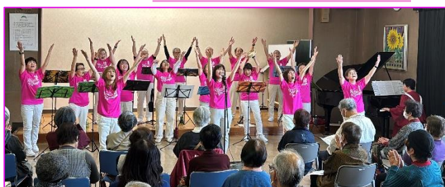
【春を迎えるコンサート】 ローザゴスペルコンサート