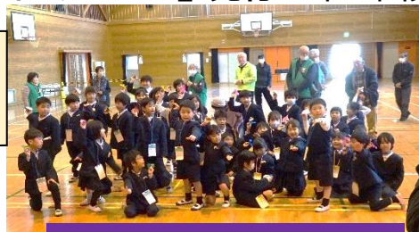
【昔の遊び体験交流】