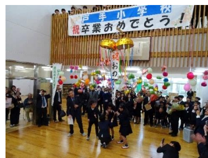
【戸手小学校卒業生を祝う会】