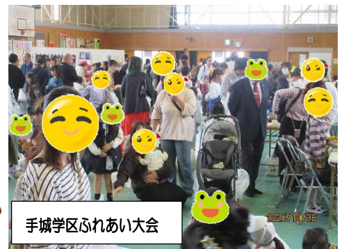
手城学区ふれあい大会