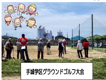
手城学区グラウンドゴルフ大会

「グラウンドゴルフ大会」は5月なのに30度に迫るような暑い日でした。みなさんの白熱したプレーに暑さも倍増でした!!