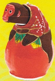
浜松張り子 (静岡県)

今回の企画展は日本の郷土玩具を通して、その成り立ちや地域の風習などを紹介します。