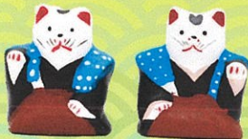
住吉土人形 (大阪府)