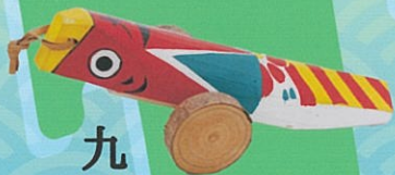
九州 の きしじ車