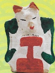
赤坂土人形 (福岡県)