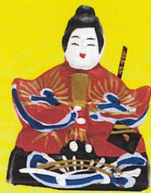
鴻巣練り物 (埼玉県)