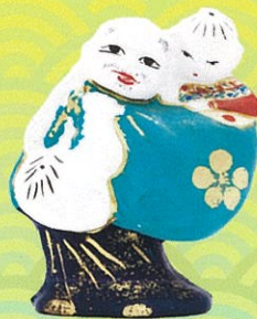
久米土人形 (岡山県)