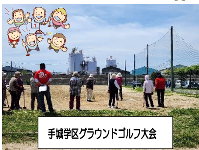
手城学区グラウンドゴルフ大会

「グラウンドゴルフ大会」は5月なのに30度に迫るような暑い日でした。みなさんの白熱したプレーに暑さも倍増でした!!