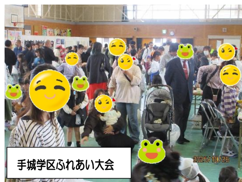
手城学区ふれあい大会