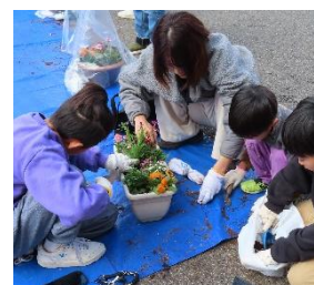
花いっぱい松永（2月28日）