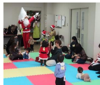
スマイルキッズ （12月9日）