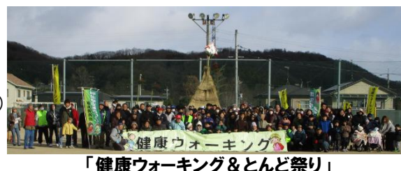
「健康ウォーキング&とんど祭り」