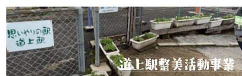
道上駅整美活動事業