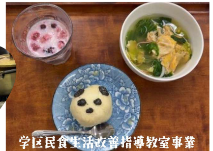
学区民食生活改善指導教室事業