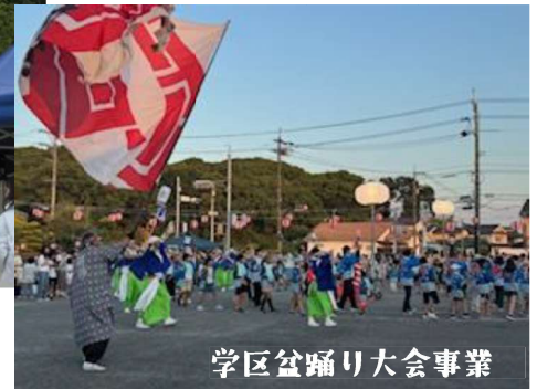
学区盆踊り大会事業