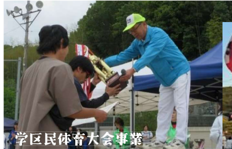
学区民体育大会事業