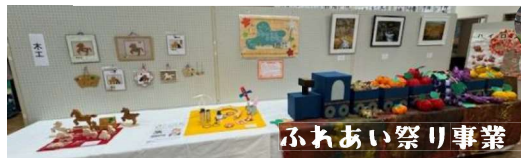
ふれあい祭り事業