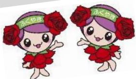
ばらのまち福山 イメージキャラクター「ローラ」

にしふかつこうりゅうかん 西深津交流館・ふかつ 深津コミュニティセンター 合同事業