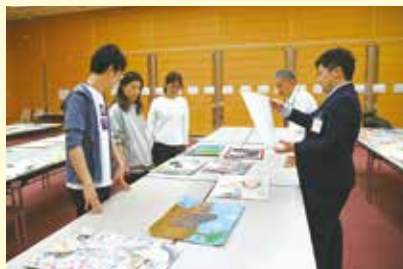
昨年度の審査のようす