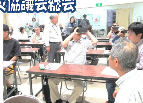
頭を360°動かしVR体験中

■6/7(日) 2025年度事業報告並びに2026年度事業計画は了承されました。総会後には福山市危機管理防災課職員から、出前講座「防災のまちづくり」と題して、最新の防災情報の確認とマイタイムラインを作成するよう話されました。またVR(ヴァーチャルリアリティ)ゴーグルを使用して、参加者は土砂災害疑似体験をしました。