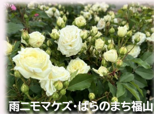
雨二モマケズ・ばらのまち福山