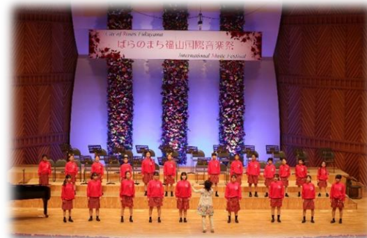
若さ溢れる アンサンブルによる演奏会