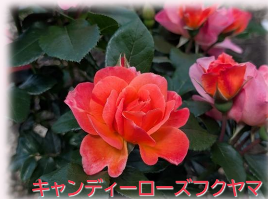
キャンディーローズフクヤマ