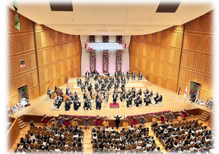
シュトゥットガルト・フィルハーモニー管弦楽団