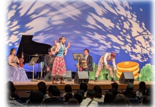
親子で楽しむコンサート