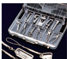
キャステムの技術力を結集したミニチュア工具とオリジナルストラップ

2005年に誕生した8万トン級のばら積み貨物船「カムサマックスバルカー」は、今や当社の顔ともいえる船。約10年間でグループ累計200隻を達成しました。私はその船をお客様のご要望に合わせて開発する仕事に携わっています。当社の大きな強みはチャレンジングな姿勢にあります。若い世代にもどんどん任せていく企業風土だからこそ、新しいものも生まれる。それは備後地方ならではのものづくりの気風といえるかもしれません。