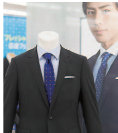
顧客満足度もナンバーワンをめざす洋服の青山。全国に店舗を展開

当社は、2013年3月25日から東京・大阪間において毎日1往復する専用貨物列車「福山レールエクスプレス号」を運行し、大型トラック80台分の貨物を鉄道に切り替える「モーダルシフト」を行い、CO 2 排出量削減による地球環境負荷の低減に向けて取り組んでいます。また、交通安全の啓発や清掃活動などを積極的に行うことで、地域の発展に向けた社会的責任も果たしていきます。制服に刺繍してある「笑顔であいさつ」を胸に刻み、今日も荷物をお届けしています。