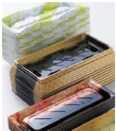
素材、デザインなど日々研究を重ね、時代に合わせた食品トレーを開発

当社は食品トレーのトップメーカー。私は生産企画の立場から各部門をつなぎ、多種多様なものづくりを支えています。当社には「世界一」を胸を張れることがもうひとつあります。それは早くからリサイクル素材の活用を力を入れてきたこと。現在当社で作る透明容器の「APET」は6割以上がエコ製品です。2014年には人材開発や素材研究のための新拠点も誕生しました。福山発信のものづくりは時代とともにますます進んでいます。