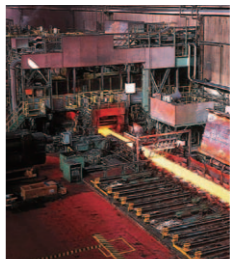
熱延工場では、ジュースの缶や車のボディなどになる前の薄板を製造

洋服の青山が紳士服・スーツの販売数でギネスに認定されたのは1998年のこと。以来その実績を伸ばし、業界をリードし続けています。今日の当社があるのは、福山の豊かな土地柄で地域に育まれてきたからと言えます。そのことを私は福山本店の店長を務めながらひしひしと感じています。地域に愛されてこそ世界ナンバーワン。だから地元への恩返しは当社の基本姿勢です。私自身も福山の人々に支えられ、まだまだ成長を続けます。