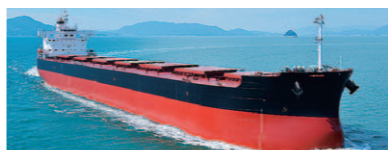
新カテゴリーを開き、市場で存在感を示すカムサマックスバルカー

無結節網を知っていますか？これは1925年に当社が世界で初めて開発に成功した、結び目のない網のこと。軽量で丈夫な無結節網は、漁業をはじめさまざまな用途に使われています。私の仕事はその生産の効率化を図り、より高い品質を追求することです。現在当社の技術力は日本だけでなく世界へ、また環境や宇宙など異分野へも展開しています。福山生まれの老舗トップメーカーとしての誇りを胸に、これからも未来をめざします。