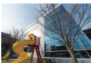
技術力だけでなく提案力も強み。地域性や安全性にも配慮した大型遊具

公園で子どもたちが遊ぶ大型遊具。当社はオーダーメイドでそれらを製作し、全国で高いシェアを誇っています。私はその企画・デザインを担当。自分の手がけた遊具が日本中の子どもたちに愛されていると思うと、こんなにうれしいことはありません。生まれ育った福山市内の公園にもそのひとつが設置されているので、感慨もひとしおです。当社のものづくりにかけるこだわりの強さは、私たち若い社員にも受け継がれています。