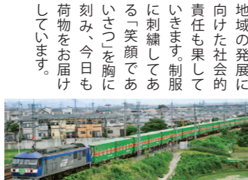
大気汚染や交通事故の防止にもつながる専用貨物列車

当社は食品トレーのトップメーカー。私は生産企画の立場から各部門をつなぎ、多種多様なものづくりを支えています。当社には「世界一」を胸を張れることがもうひとつあります。それは早くからリサイクル素材の活用を力を入れてきたこと。現在当社で作る透明容器の「APET」は6割以上がエコ製品です。2014年には人材開発や素材研究のための新拠点も誕生しました。福山発信のものづくりは時代とともにますます進んでいます。