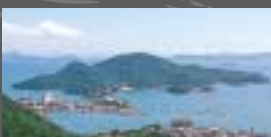
上:1939年(昭和14年)に郵便切手のデザインとなった。 下:現在も変わらない美しい景色を堪能できる。