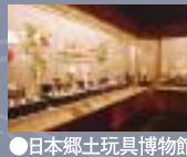
●日本郷土玩具博物館

一般には非公開だが、みろくの里セット村には時代劇の撮影が可能な常設オープンセットがあり、1989年(平成元年)に公開された座頭市をはじめ写楽や梟の城、助太刀屋助六などの映画やテレビドラマが撮影された。