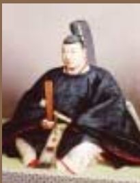
福山誠之館同窓会蔵

福山藩阿部7代藩主。わずか25歳で江戸幕府の老中となり、27歳で老中首座に就任。幕末の安政の改革を断行した。人材育成のために藩校「弘道館」(当時は新学館)を「誠之館(せいしかん)」福山誠之館同窓会蔵に改め、身分によらない教育を行った。