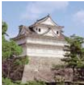
伏見櫓(国重要文化財)

京都伏見城の「松の丸東櫓」であった遺構を徳川秀忠から拝領したもので、白壁三層の豪華な姿に桃山時代の気風がうかがえる。