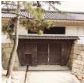
筋鉄御門(国重要文化財)

現在の天守閣は1966年(昭和41年)に再建されたもの。天守閣の中には、歴代藩主の遺品や資料のほか、考古・歴史資料などが収蔵・展示されている。春には城内にたくさんの桜が咲き誇り、福山屈指の名所として多くの花見客が訪れる。