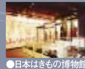
●日本はきもの博物館