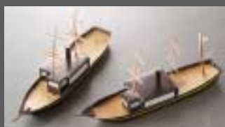
● 平成いろは丸のペーパークラフト