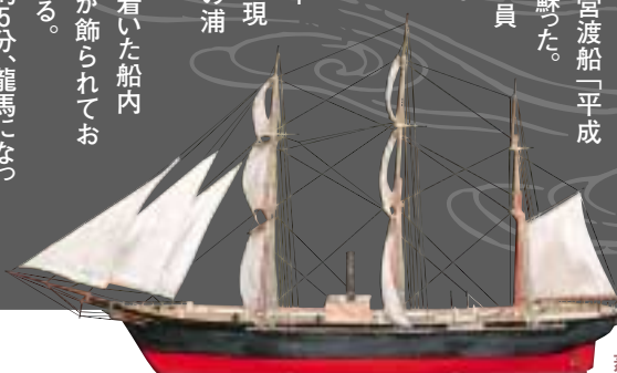
蒸気帆船(模型):いろは丸展示館資料