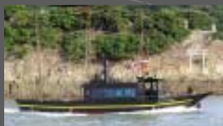
● 市営渡船「平成いろは丸」