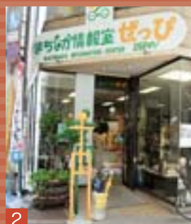
2 空き店舗活用策としてオープンした「まちなか情報室 ゼッピ」。福山の手づくりアートや情報にふれてみては。

ヨーロッパ風の明るい色調とクラシックなデザインの街路灯がマッチしたひさまつどおり。夜はライトアップされた植木が美しく、つい歩いてみたくなる。