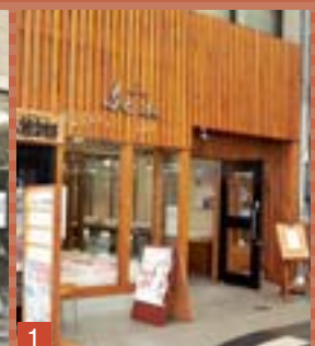
1 「ギャラリーふくふく」と「まちなか情報室 ゼッピ」。

福山の駅前を代表する商店街の一つで、アーケード街にはレトロとモダンがミックスされた雰囲気たっぷり!