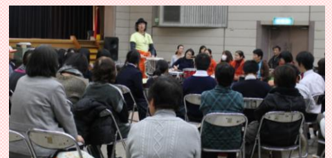
2014年度 ふくやま人権・平和フェスタの様子