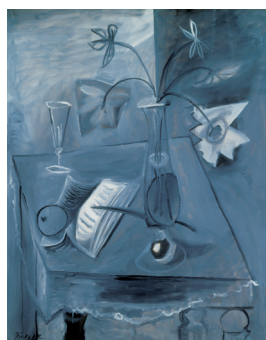
《静物》1941年 富山県立近代美術館