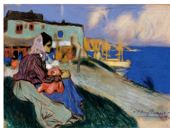
《ロマの女》1900年 三重県立美術館（三重県企業庁寄託） ※前期のみの展示

作品は、全国の主要美術館や個人コレクターから、油彩、水彩・素描、版画の名作約90点を集め、前期・後期それぞれ約70点を展示いたします。