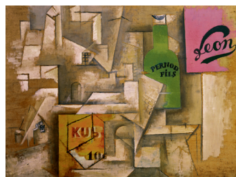
《ポスターのある風景》1912年 国立国際美術館