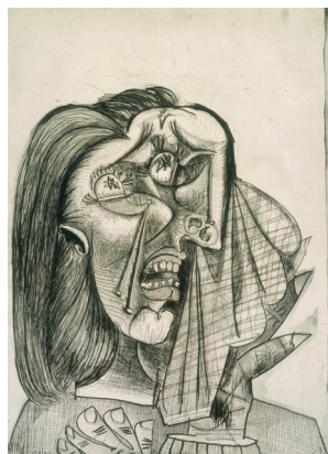
《泣く女》1937年 和歌山県立近代美術館 ※前期のみの展示