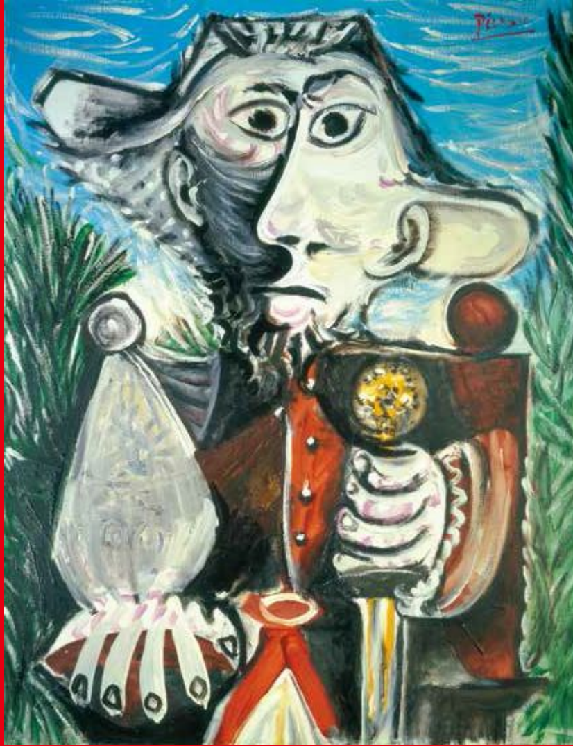
パブロ・ピカソ《剣を持つ男》1969年 山形美術館寄託