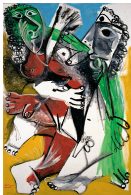
《男と女》1969年 国立西洋美術館