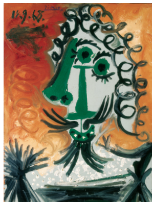
《近衛騎兵》1968年 ぶくやま美術館寄託