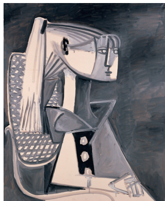
《シルヴェット・ダヴィット》1954年 ポーラ美術館