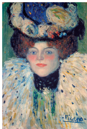
《女の顔》1901年 笠間日動美術館