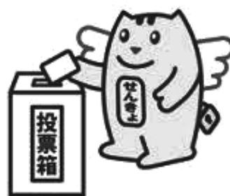
明るい選挙のイメージキャラクター 「選挙のめいすいくん」