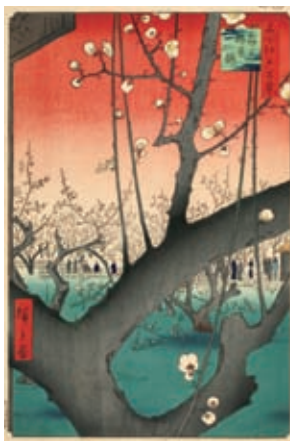
歌川広重《名所江戸百景 亀戸梅屋舗》1857年 ●