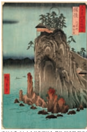
歌川広重《六十余州名所図会 備後 阿武門 観音堂》1853年 ●