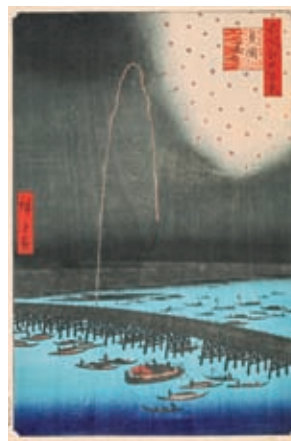
歌川広重《名所江戸百景 両国火花》1857年 ●