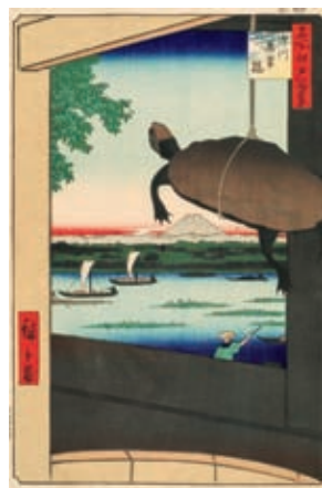
歌川広重《名所江戸百景 深川万年橋》1857年 ●