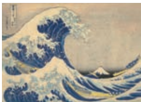
葛飾北斎《富嶽三十六景 神奈川沖浪裏》1829-32年 ●