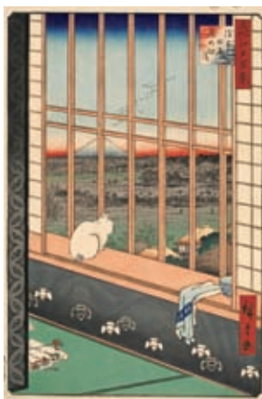
歌川広重《名所江戸百景 浅草田雨西の町詣》1857年 ●