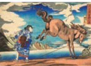
歌川国芳《近江の国の勇婦お兼》1831-32年頃 ●