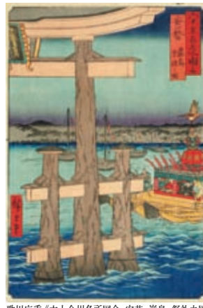
歌川広重《六十余州名所図会 安芸 巖島 祭礼之図》1853年 ●