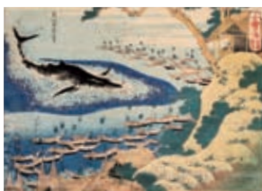
葛飾北斎《千絵の海 五島鯨突》1832年頃 ●