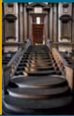
参考資料:《ラウレンツィアーナ 図書館玄關から閲覧室への階段》