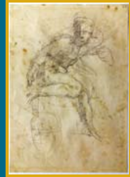
ミケランジェロ・ブオナローティ 《システーナ礼拝堂天井画のための2つの裸体像習作》