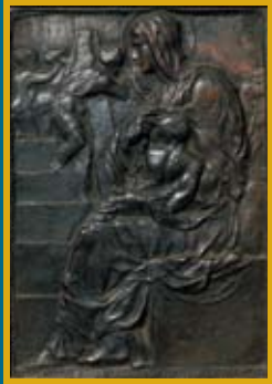
16世紀の芸術家 《階段の聖母 (ミケランジェロ原作)》

本展により、システーナ礼拝堂の壮大な天井画を描き、ラウレンツィアーナ図書館などの名建築を残した「神のごときミケランジェロ」の天才の秘密が明らかとなるでしょう。なお福山は日本巡回展の最終会場となります。