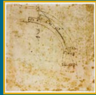
ミケランジェロ・ブオナローティ 《サン・ピエトロ大聖堂ドーム断面図》