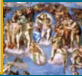
参考写真: システーナ礼拝堂壁画 《最後の審判》(部分・中央)