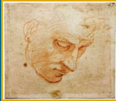
ミケランジェロ・ブオナローティ 《システーナ礼拝堂天井画〈大洪水〉のための男性頭部習作》