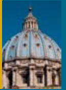
参考写真: 《サン・ピエトロ大聖堂》 (部分)

いづれも、カーサ・ブオナローティーニ