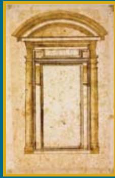
ミケランジェロ・ブオナローティ (ラウレンツィアーナ図書館、閲覧室から玄關 への扉口案)