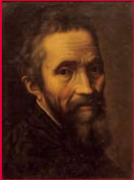
マルチェッロ・ベヌステイに編纂《ミケランジェロの肖像》 カーサ・ブオナローティ蔵