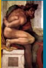
参考写真: ミケランジェロ 《青年裸体像》(部分)