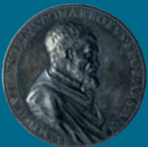
レオーネ・レオーニ (ミケランジェロのメダル)

イタリア・ルネサンス最大の天才ミケランジェロ・ブオナローティ (1475-1564)。ジョルジョ・ヴァザーリが『画家・彫刻家・建築家列伝』のなかで「神のごとき」と形容した彫刻家、画家、建築家である。