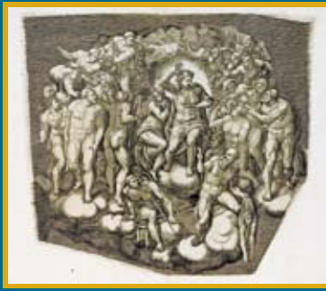
ジョルジョ・キージ《審判者キリストと聖母マリア、聖者たち (ミケランジェロ《最後の審判》にもとづく)》