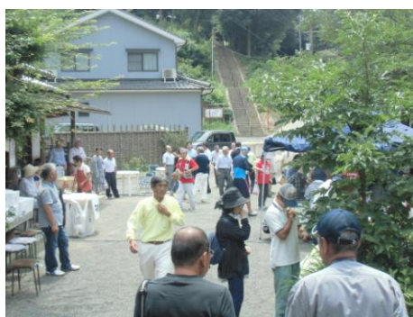
外で、地元の特産品などを販売している様子