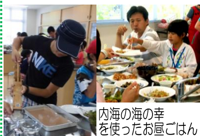
内海の海の幸 を使ったお昼ごはん