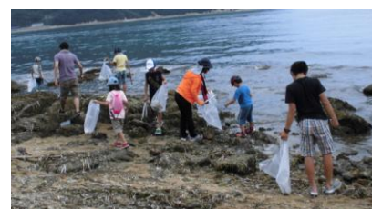
入双海岸でのビーチクリーン