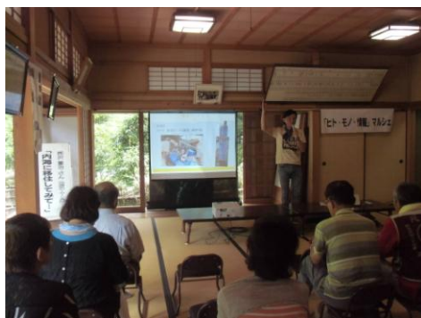
館の中での発表をしている様子

せっかく素晴らしい活動をしている、地元であまり知られていなかったり、団体同士が話しをする場がないなどの課題をこの講座で、もっと広く活躍できる場を増やすきっかけにしていきたいと思います。