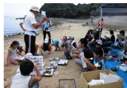
入双海岸での環境調査