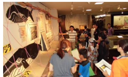
資料室で捕鯨の歴史を学ぶ

内海町に初めて来られた人も多く、歴史や自然に触れ、内海の魅力を感じてもらえるツアーになりました。