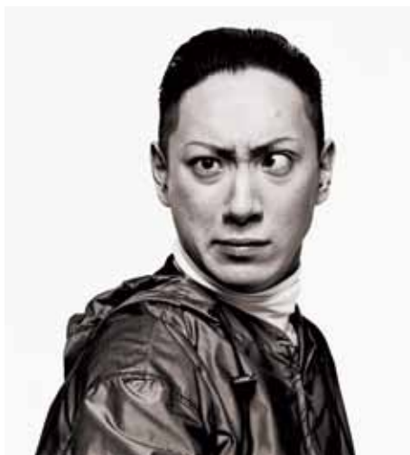
市川新之助(現 海老蔵) 1999年