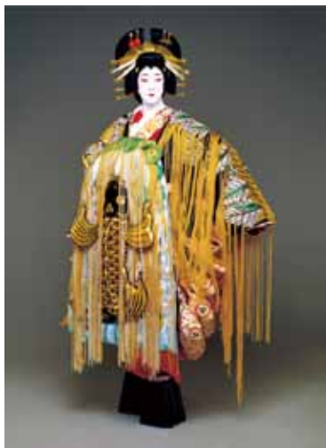
坂東玉三郎 『助六由縁江戸桜』揚巻 1988年