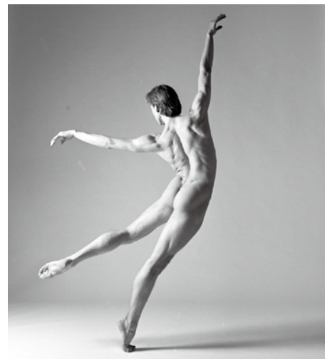
VLADIMIR MALAKHOV 1998年