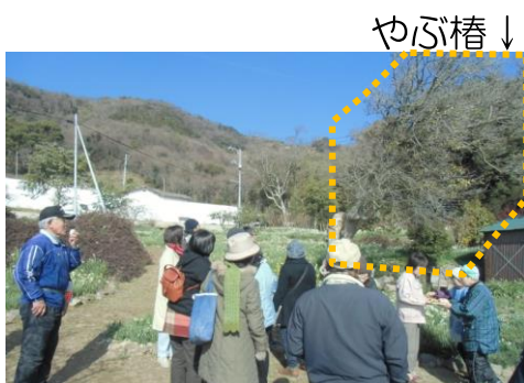
解説を聞きながら見学

見学の途中、ピザ窯で焼いたピザもいただきました。もちろんピザにも、海苔がのっていました。見て、食べて、体験して、楽しみながら地域の元気をもらいました。