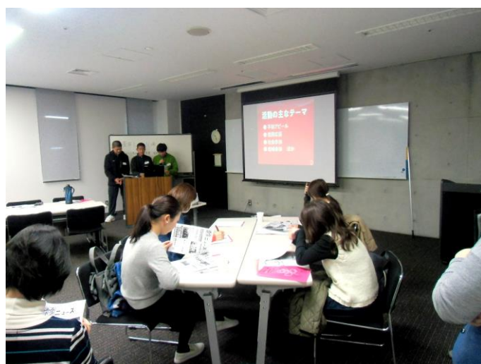
← ↑ 南部の事業報告