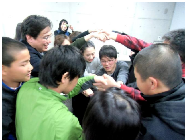
アイスブレイク(人間知恵の輪)