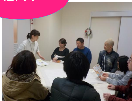
福山ネウボラ「あのね RIM」