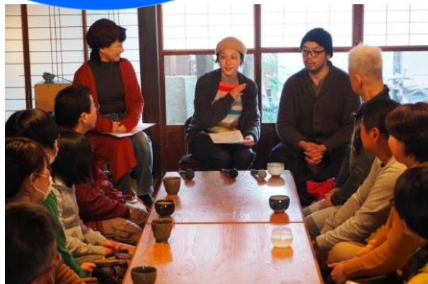
自転車カフェ&バー 汐待亭