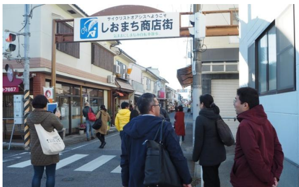
しおまち商店街を散策