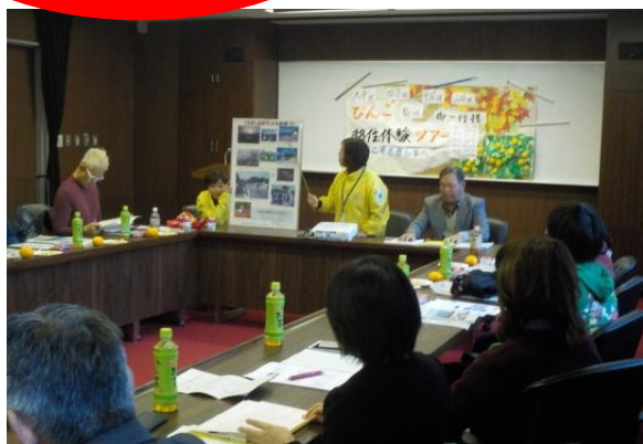
サギ・セミナー・センターにて