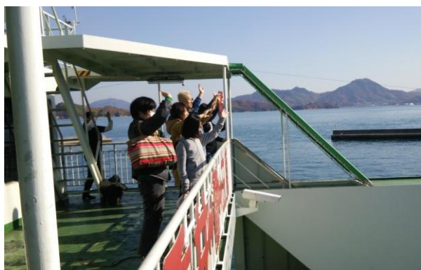
鷺港からはフェリーで帰りました