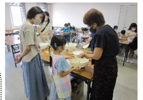
【びんごアート研究会】