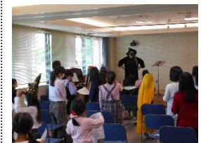
【海のみえる合唱教室】